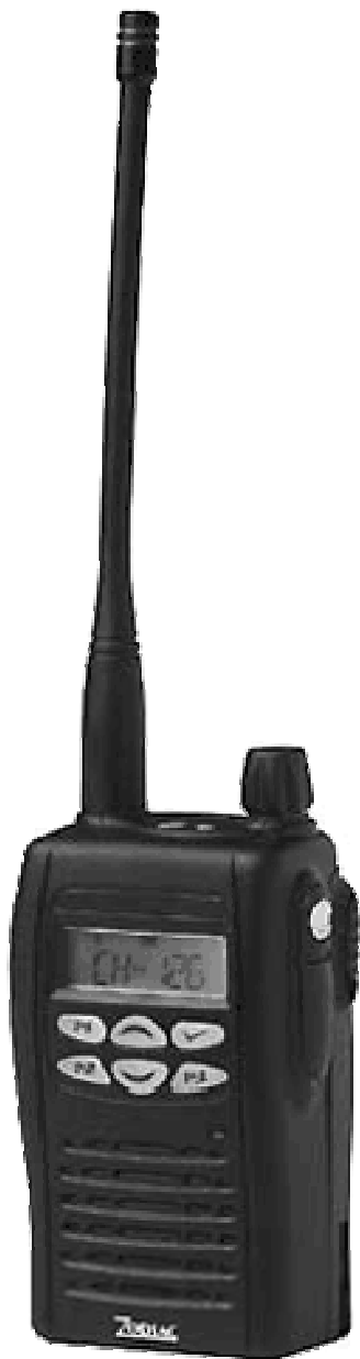
Zodiac Proline 100W

Radiotéléphone pour l'appel d'urgence REGA